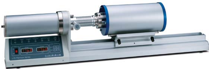
水平型ディラトメーター

★ 熱膨張率測定で世界的に多くの実績と 60 年の経験を持つドイツ・リンザイス社製の熱機械分析装置(TMA/ディラトメーター)は精度と信頼性で高く評価されています。